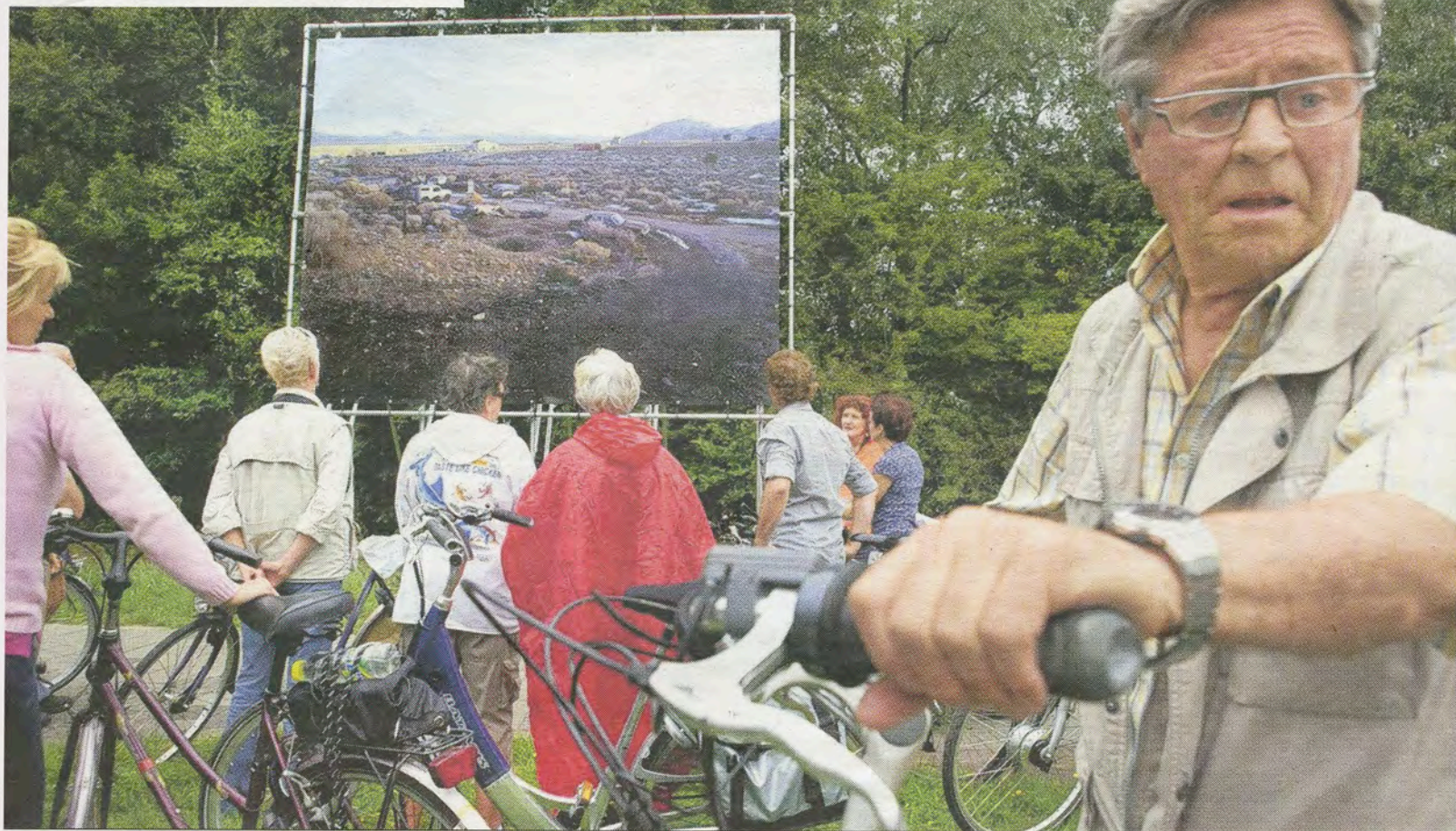
Een foto in het Gestelse buurtschap Halder van het kunstproject Elders trekt de nodige aandacht. De grote foto laat een verlaten plek in de Amerikaanse staat Nevada zien.