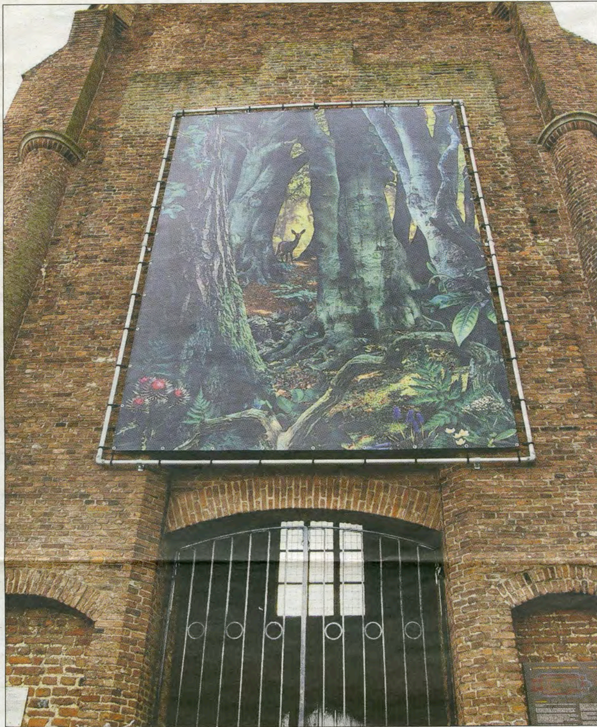
Het billboard aan de toren op het Gestelse Petrus Dondersplein.