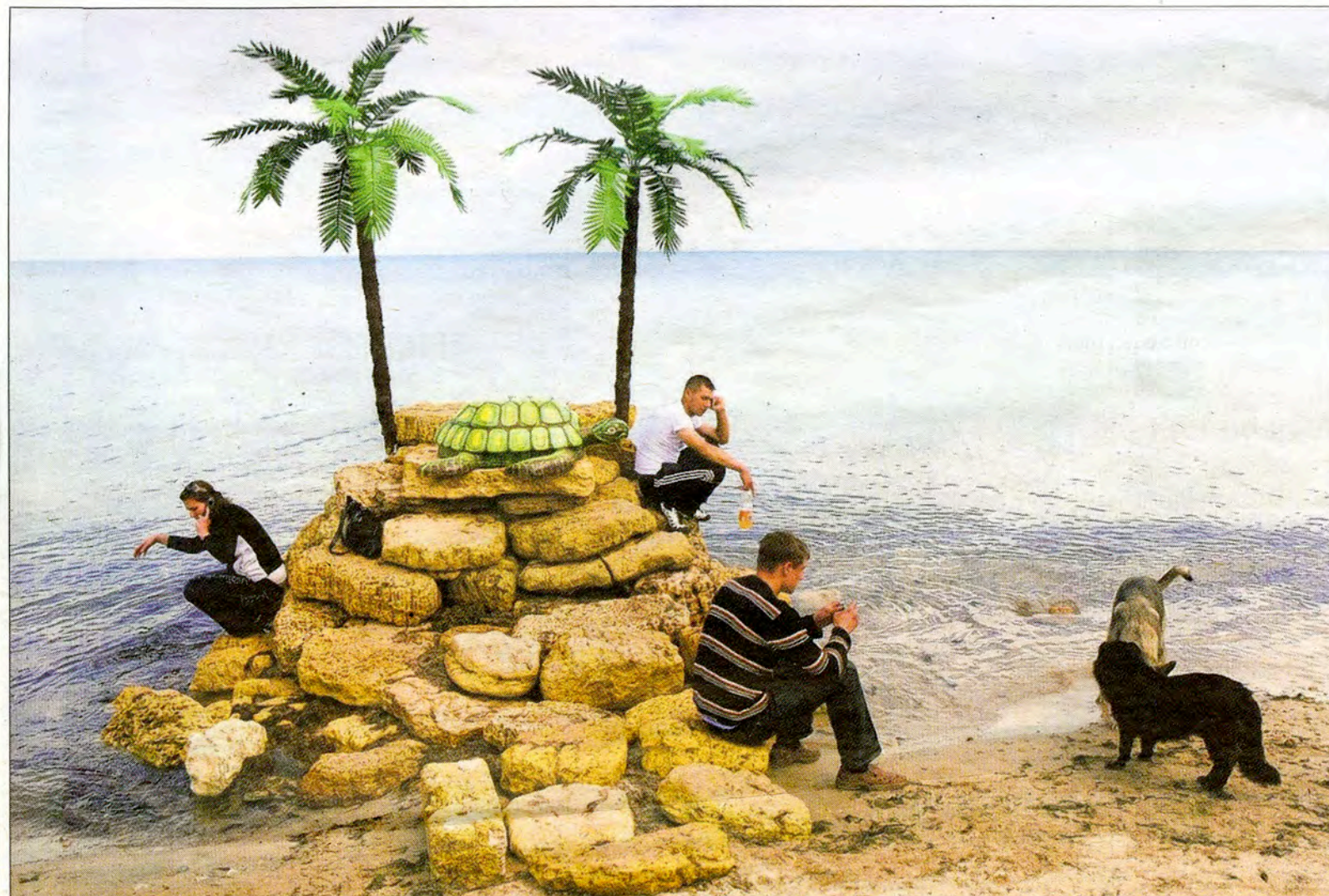
De Belgische fotograaf Nick Hannes houdt in zijn fotografie van tegenstellingen. Reizend door Oost-Europa trof hij in het plaatsje Yevpatrija in de Oekraïne dit namaakeiland aan, compleet met schildpad. Bij de jongeren die hier hun toevlucht gezocht hebben, lijkt de verveling toegeslagen. Deze foto is opgenomen in het Gestelse kunstproject Elders. Hannes, afkomstig uit Antwerpen, heeft een fascinatie ontwikkeld voor de landen van de voormalige Sovjet-Unie. Met regelmaat portretteert hij treffend de sociale en politieke omstandigheden in deze landen.

Volger zoekt inwoners van Sint-Michiëlsgestel die een Ansichtkaart hebben met daarop een landschap. Het gaat om de plek, maar ook om het verhaal erachter, de herinnering. Het resultaat wordt straks op de vloer van supermarkten geplakt. Reactie: marc@volger.com