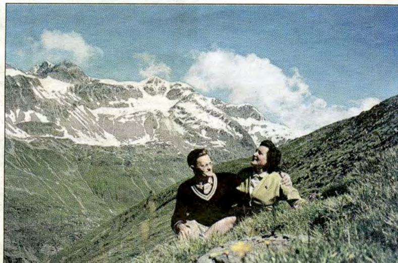
Andrea Stultiens is een fotografe uit Nijmegen die zich toelegt op de documentaire-achtige fotografie. Als samensteller heeft ze het levensverhaal van het echtpaar op de foto vastgelegd aan de hand van zo'n duizend foto's die ze uit een archief heeft opgeduikeld. Enkele van die idyllische foto's zijn straks te zien in Gestel.

Tegenstellingen, contrasten. Daar moeten de makers van de Gestelse buitenexpositie Elders het van hebben. Tegen de achtergrond van ongerepte Brabantse natuur of de soms compleet aangeplante natuur, sieren vanaf begin juni zo'n 25 billboards het Gestelse landschap.